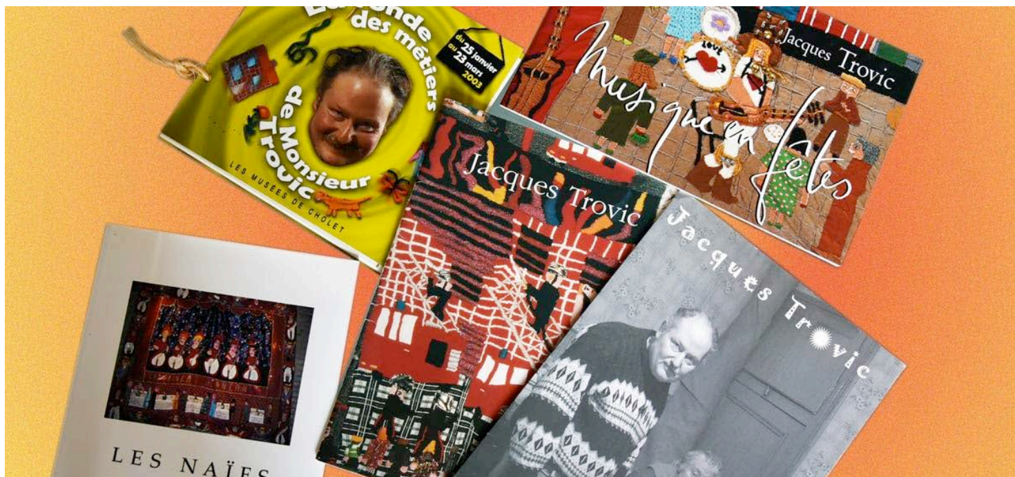
Quelques catalogues d'expositions de Jacques Trovic