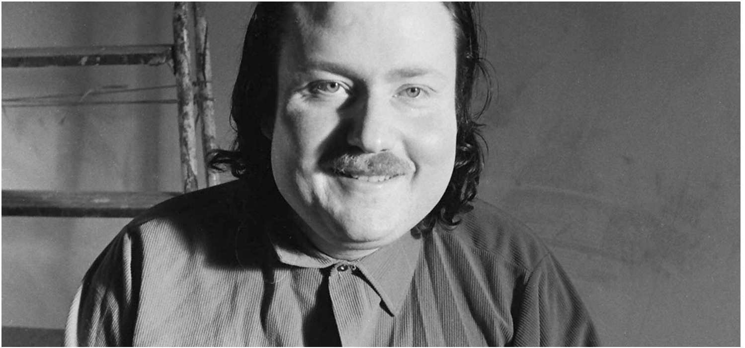
L'homme Trovic en 1983. il a 35 ans.